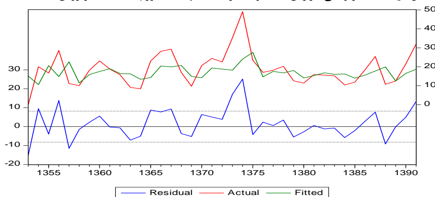
نمودار ۵: مقادیر واقعی، برازش شده و مقدار خطا یا پسماند تورم با استفاده از روش GARCH

مقادیر واقعی (Actual)، برازش‌شده (Fitted) و مقدار خطا یا پسماند (Residual) معادله فوق به صورت زیر رسم شده است. بر این اساس بی‌ثباتی تورم به صورت پسماند برآورد معادله فوق در نظر گرفته شده است.